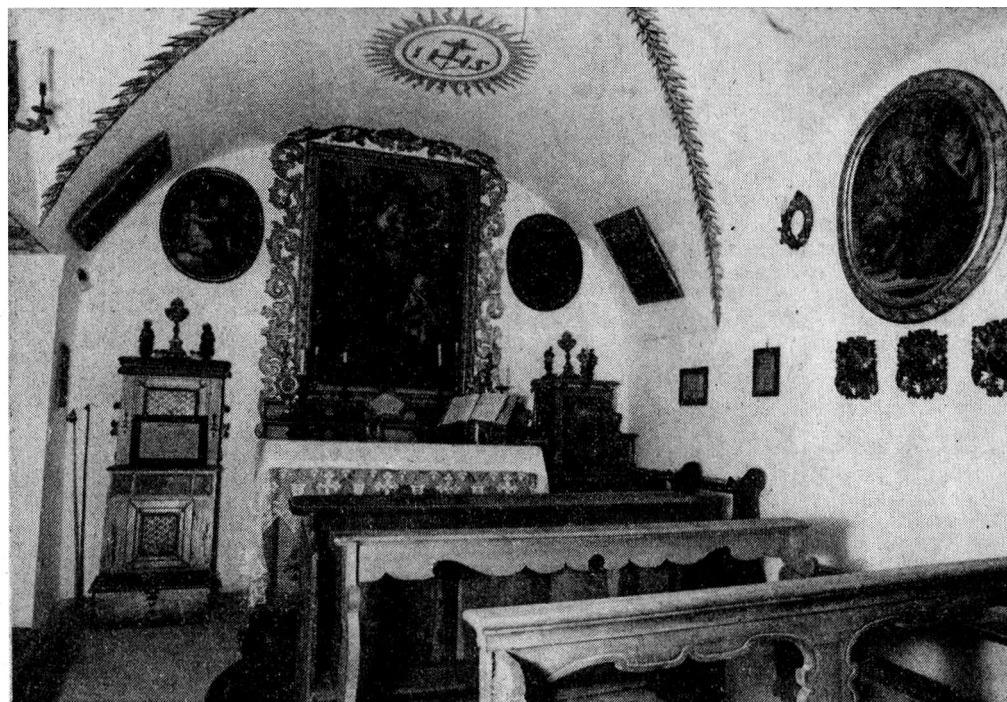
La cappella (interno)