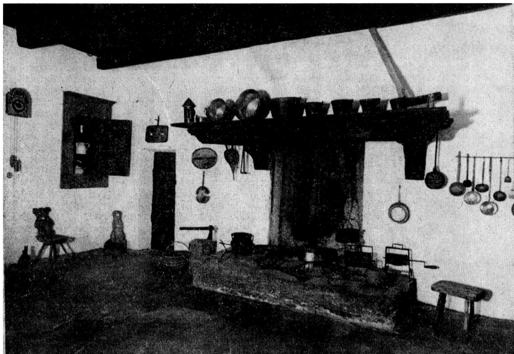
La cucina (focolare e cappa)